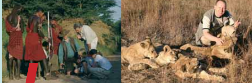
Spuren im Sand – führen auf die richtige Fährte