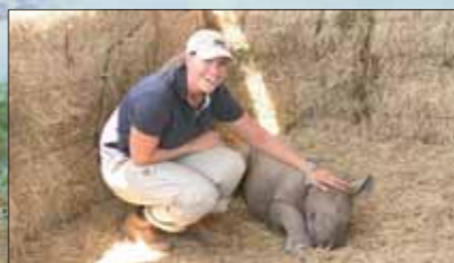
Ein Nashorn-Junges – einfach zum Knuddeln

Wildlife Travel Consultants Auguste-Viktoria-Str. 2 D-14193 Berlin Tel.: +49 (0)30 83 20 08 56 Fax: +49 (0)30 83 20 08 57 E-Mail: n.tarlach@wildlife-travel.eu www.wildlife-travel.eu